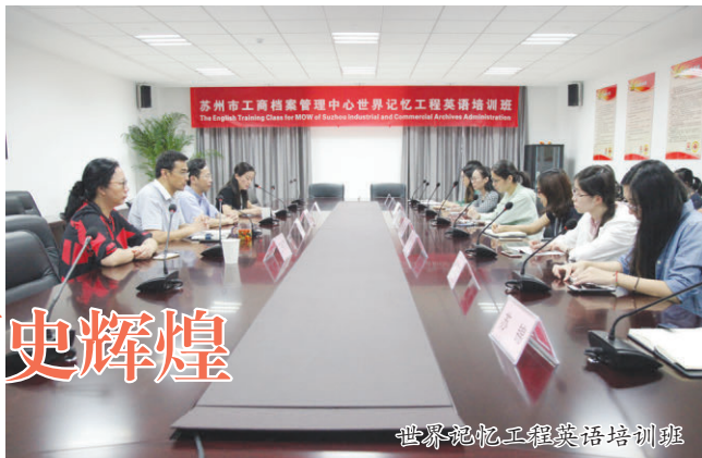
世界记忆工程英语培训班