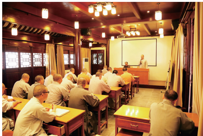
兴福寺第四期僧才培训班

兴福寺僧才培养的宗旨是“学修并进、知行合一”。多年来寺院坚持以培养“政治上靠得住、宗教上有造诣、品德上能服众、关键时起作用”的合格僧才为目标,以常规培训和集中培训为主、佛学院就读和自学为辅的方式,有效促进了僧团和谐稳定,四众弟子和合共住。为了营造更好的学习氛围,打造学习型寺院、学习型团队,提升僧团综合素质,寺院通过课堂授课的方式,定期礼请教界法师和学界教授来寺授课,并以教学相长