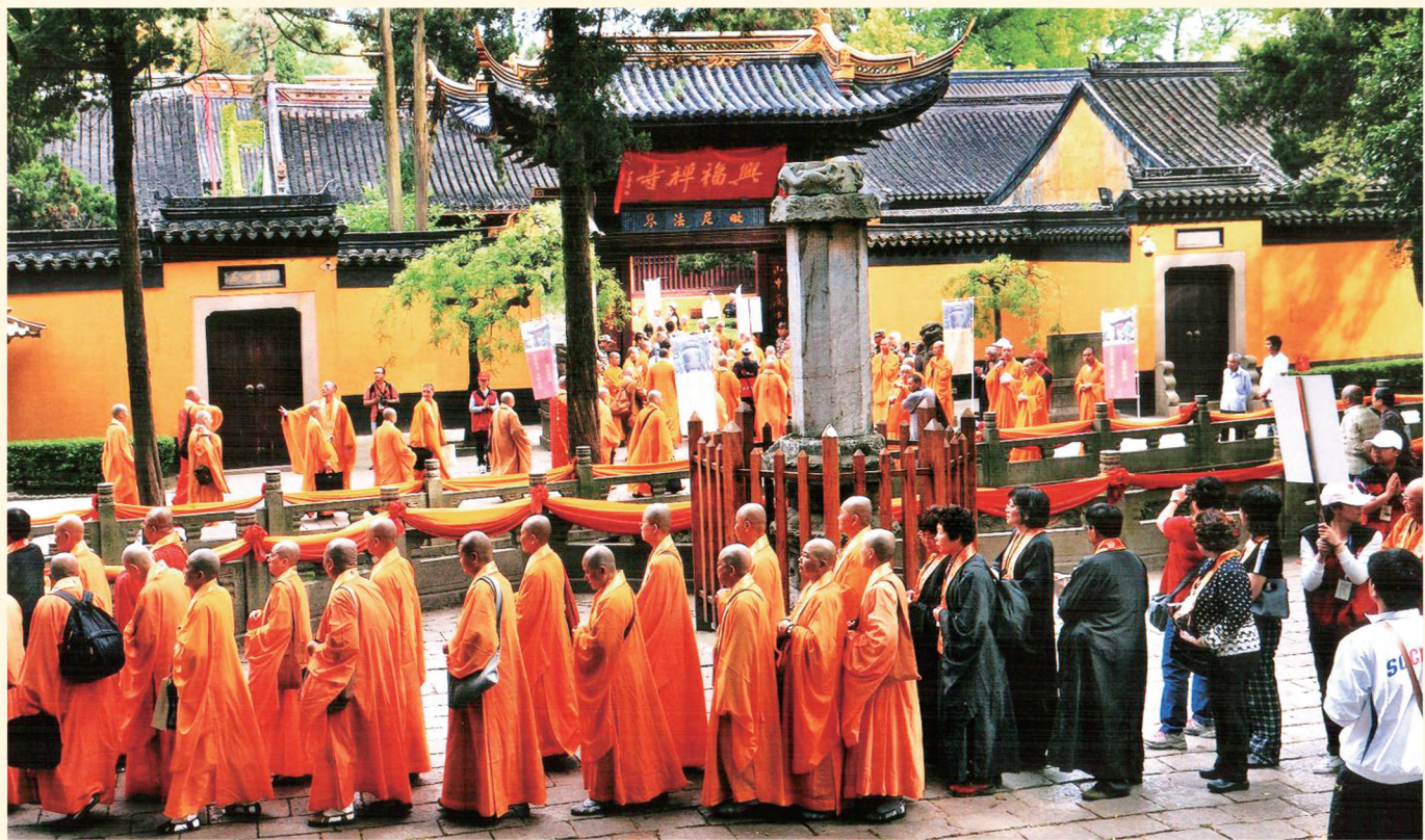
封面：峨眉山金頂 封底：興福禪寺法會現場