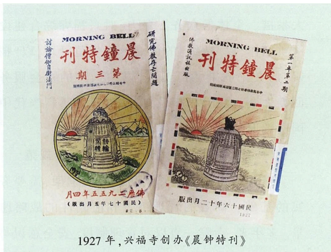
1927年，兴福寺创办《晨钟特刊》