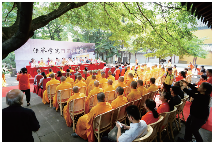
法界学院首届开学典礼

2009年新一代领众团队的成立，为寺院注入了新鲜的血液，是新时代传统寺院转型的一座里程碑。通过不懈的努力，兴福寺先后荣获了“全国创建和谐寺观教堂先进集体”和“江苏省五星级宗教活动场所”等多项荣誉称号。2016年在常熟市委、市政府提出“打造精致城市”的城建理念指导下，寺院开始实施了“强基固本不间断，美化环境求特色，文化立寺不动摇，服务社会创品牌”四