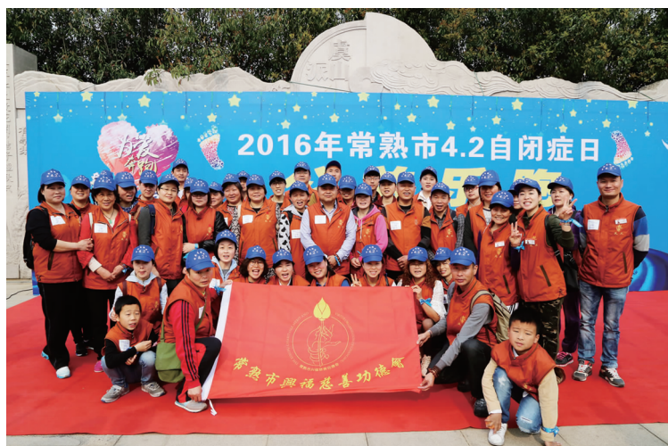
常熟市兴福慈善功德会参加点亮蓝星公益助跑活动