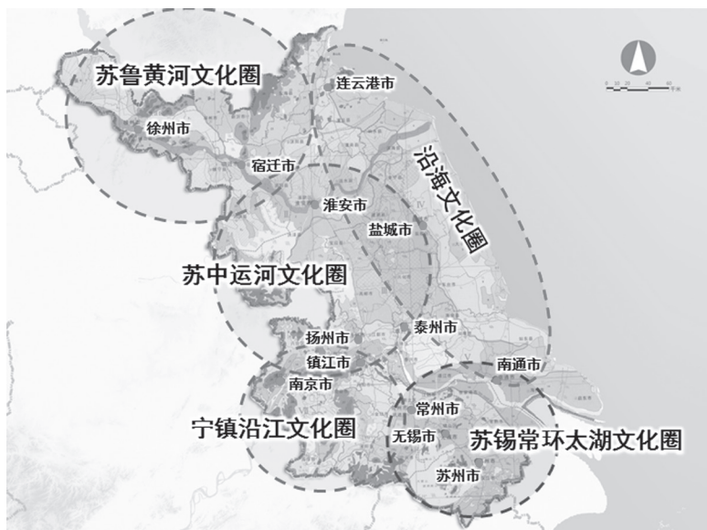
图3 江苏五大亚文化分区

拥有大量以蕴含诗情画意的文人园林为特色的江南园林。江南园林作为吴文化最具代表性的意象指征之一，在立意、置景、建造上都有极高的品位，是吴地人利用自然、改造自然、妙用自然的杰出代表。