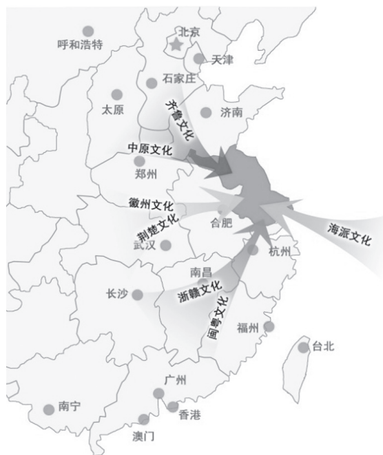
图2 江苏外来文化影响图

位于环太湖地区的苏、锡、常三地是吴文化的发源地。吴文化作为江苏省境内原生的和最早定型的重要文化类型，具有强大的文化影响力，并在地域空间塑造中得到反映和沉淀。环太湖地区的建筑多注重与自然山水形态和谐共生，近水亲水，呼应低山，建筑体量轻盈婀娜、秀美灵动，建筑色彩淡雅、尺度宜人、装饰考究，形成了高低错落、粉墙黛瓦、庭院深邃的建筑空间风貌。同时，作为雅士汇集之地，吴地人文荟萃，