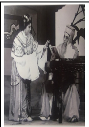
图5.1957年锡剧《追鱼》之鲤鱼精与张珍，图片来自《太湖一枝梅》。