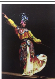
图4、1994年锡剧《虞姬之死》之虞姬，图片来自《太湖一枝梅》。