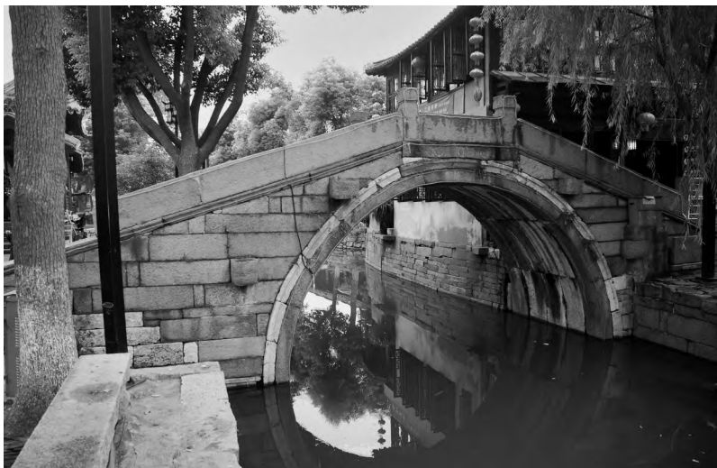
图一五 三元桥和万安桥