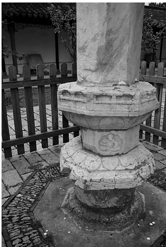
图一二 佛顶尊胜陀罗尼经幢(下半部)