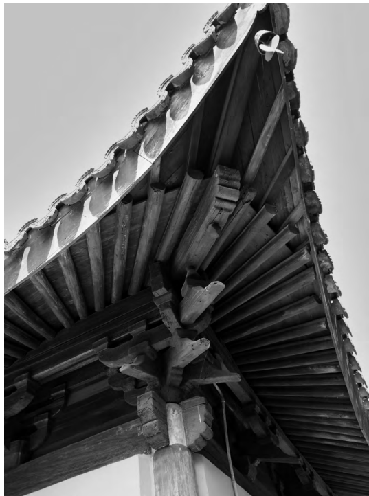
图九 保圣寺天王殿建筑