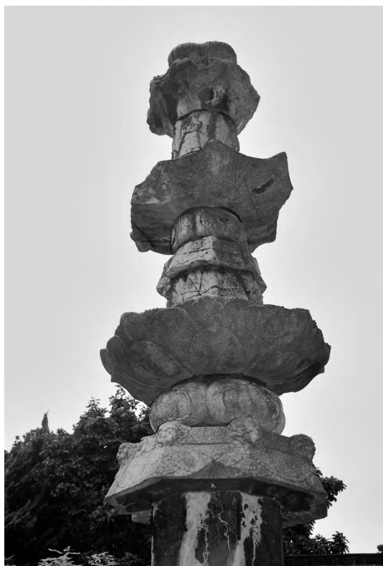
图一一 佛顶尊胜陀罗尼经幢(上半部)