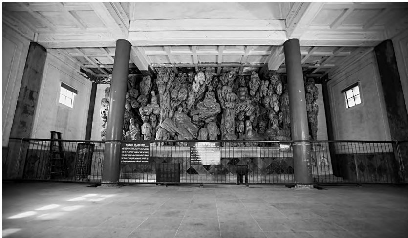
图四 古物馆及保圣寺 罗汉塑像

院)位于姚家弄东,建于清顺治十二年(1655年)。用直镇崇尚道教者不少,曾有许多并不出家的“在家道士”居住在“道士街”。