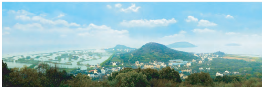
图2 苏州市三山古村落临水格局

“君到姑苏见, 家家皆枕河 ④ ”。江南人居聚落的自然山水基底是河湖纵横的水乡, 因此, 从大的地理环境而言, 江南以其水乡特色而区别于我国的其他地区。同时, 经历代江南人为水利、城建需要, 因势利导, 脉分缕刻 ⑤ , 最终塑成了今日之人居环境的自然地理格局。江南众多江河、湖泊、港埔以及贯穿南北的大运河所形成的稠密水网, 不仅形成了地理意义上的城镇与乡村的经络关联, 也形成了政治、经济、文化上精神关联, 同时也形成了江南地区独特的镇村布局格局。这其中, 以吴淞江水系和大运河沿线镇村体系发展最为典型。以吴淞江流域为主体的太湖东部是历史上最经典的江南地区, 也是唐代中后期“江南好”、“江南曲”、“望江南”、“忆江南”等有关江南以及田园诗词的文学意象的发源地 ⑥ 。如位于太湖三山岛上的苏州三山古村不仅充分体现了“世人呼为小蓬莱”的湖岛风光, 更是太湖流域“三山文化”史前文明的物化例证, 保留着古代农业文明最古老的遗迹(图2)。三山村围绕湖岛码头逐水而居、聚族而居逐渐形成了现今的聚落形态。可以说, 江南地区以水为核心的自然基底, 从最基础的层次上限定了聚落文化富有个性的发展方向、地域格局以及文化景观的区域特性。而明清