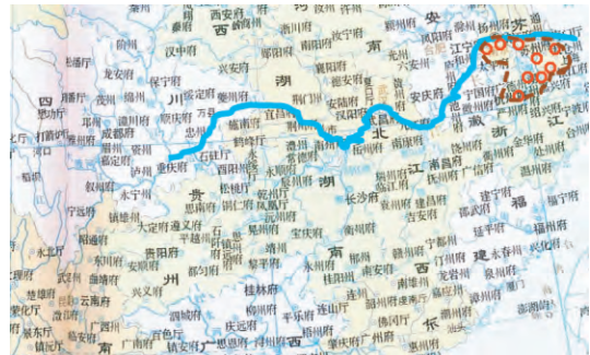
图1 清代江南地域范围示意图