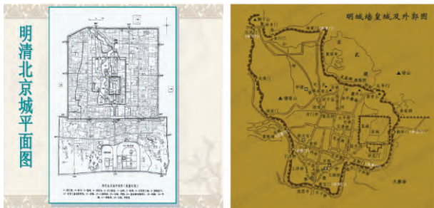
图3 明清时期北京与南京城平面图对比

在城镇的营建中,亦是如此。明朝都城南京的城郭并不像北方都城的方正(图3),而是随山势自然铺陈,正如吴良镛先生曾评述的,“经过江南人自觉不自觉的设计经营,江南地区大到城市、小到村镇,都能与自然揉为一体而形成与山水环境契合的布局形态,显现出江南区域规划设计的特色”。