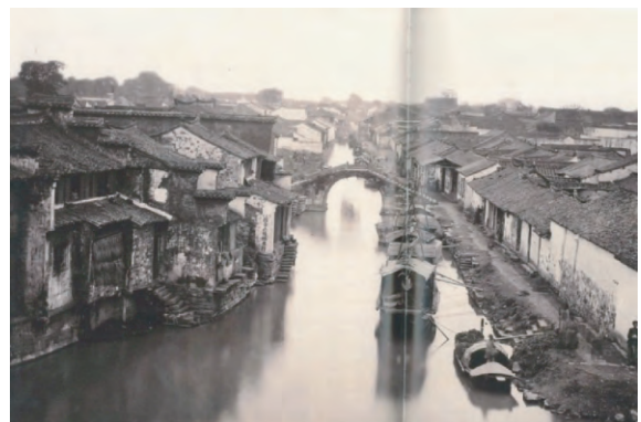
图4 姑苏水巷风貌

苏南村落建筑的精致与明清时期江南地区大量的“土匠”同样密不可分。“农业精耕细作所训练出的勤劳的双手和社会上崇尚灵巧的工艺美术又进一步推动了以太湖流域对木构件和砖砌体精益求精的追求,这片诞生过香山帮的土地上本来就不缺乏能工巧匠 ⑧ ”。但是,江南建筑的精美与晋商宅邸的奢华、闽南建筑的多彩迥异其趣。构件雕花不求繁复,却寓意深刻,雕工精细,体现了士大夫阶层的审美情趣,其与粉墙黛瓦的传统建筑,青石窄巷和木质廊道共同构成了江南建筑文化的典型特征(图4)。