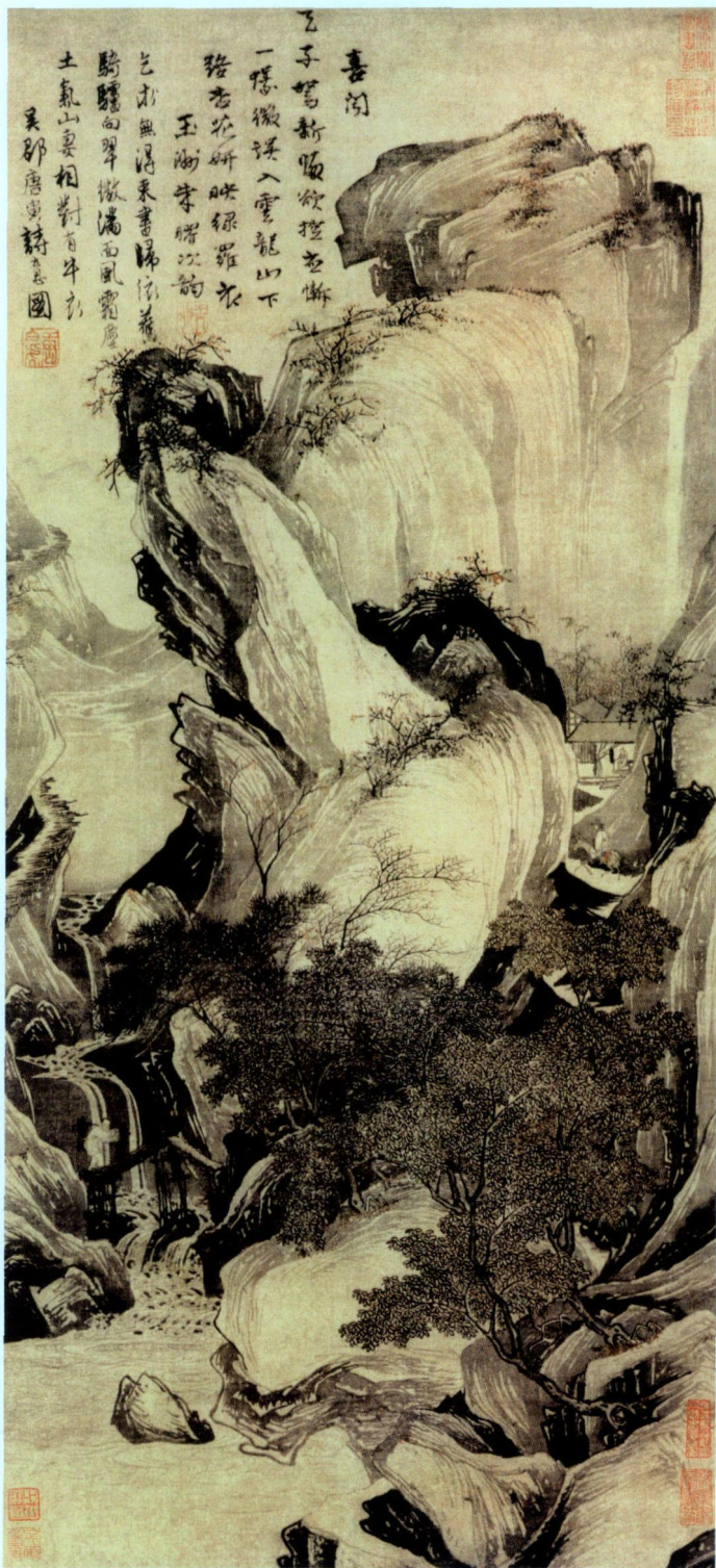
《骑驴思归图》 立轴 绢本 淡设色 纵77.7厘米 横37.5厘米 上海博物馆藏

此图为唐伯虎的创新杰作。图画峻险山崖、盘曲栈道、急湍危桥、葱郁林木、骑驴旅人。用笔师法李唐，刚劲犀利，皴法把大斧劈皴拉长拉细，更显活泼滋润，用墨浓淡精到，既有北派山水的立体感，又有南派山水的情趣味。