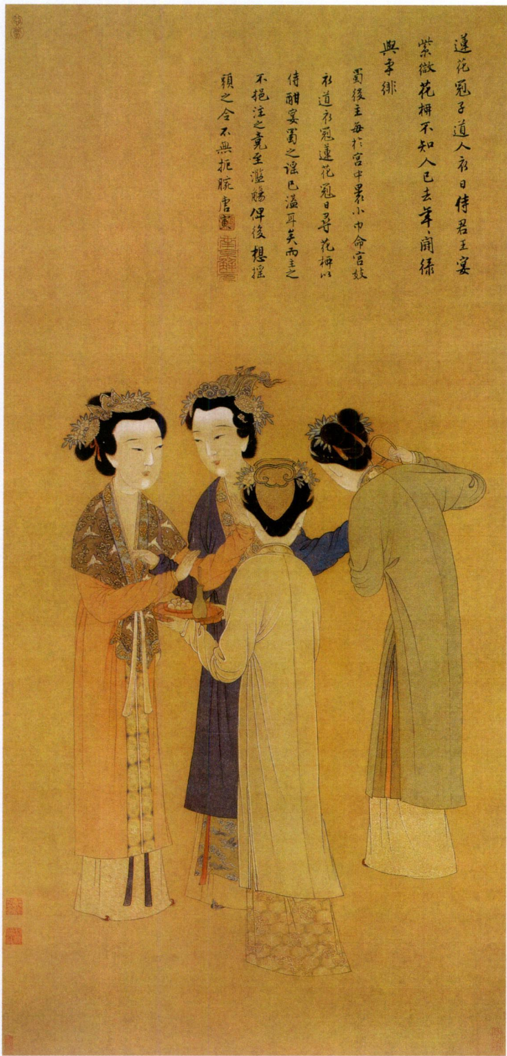
■《孟蜀宫妓图》 立轴 绢本 设色 纵124.7厘米 横63.6厘米 北京故宫博物院藏

此图以浓笔重彩画宫妓四人，衣着华贵，云髻高耸，青丝如墨，头饰花冠。从人物穿戴来看，正面两位地位高贵，而背向两位疑是奴婢，正奉酒捧食。图中写宫妓正劝酒作乐，青衣女子似手拿酒盏，正让绿衣女子斟酒，而红衣女子已不胜酒力，正摆手欲止，却被青衣女子挡住。劝、止之间的神态举止被刻画得生动传神。背后无衬景。人物衣饰线条流畅，设色浓艳。服饰上的花纹刻画得十分精细，人物面部用传统的“三白法”表现，晕染细腻，表露出宫廷富贵的生活气息。作者借此图披露孟蜀后主的糜烂生活，有讽喻之意，可证于自题诗、题跋。