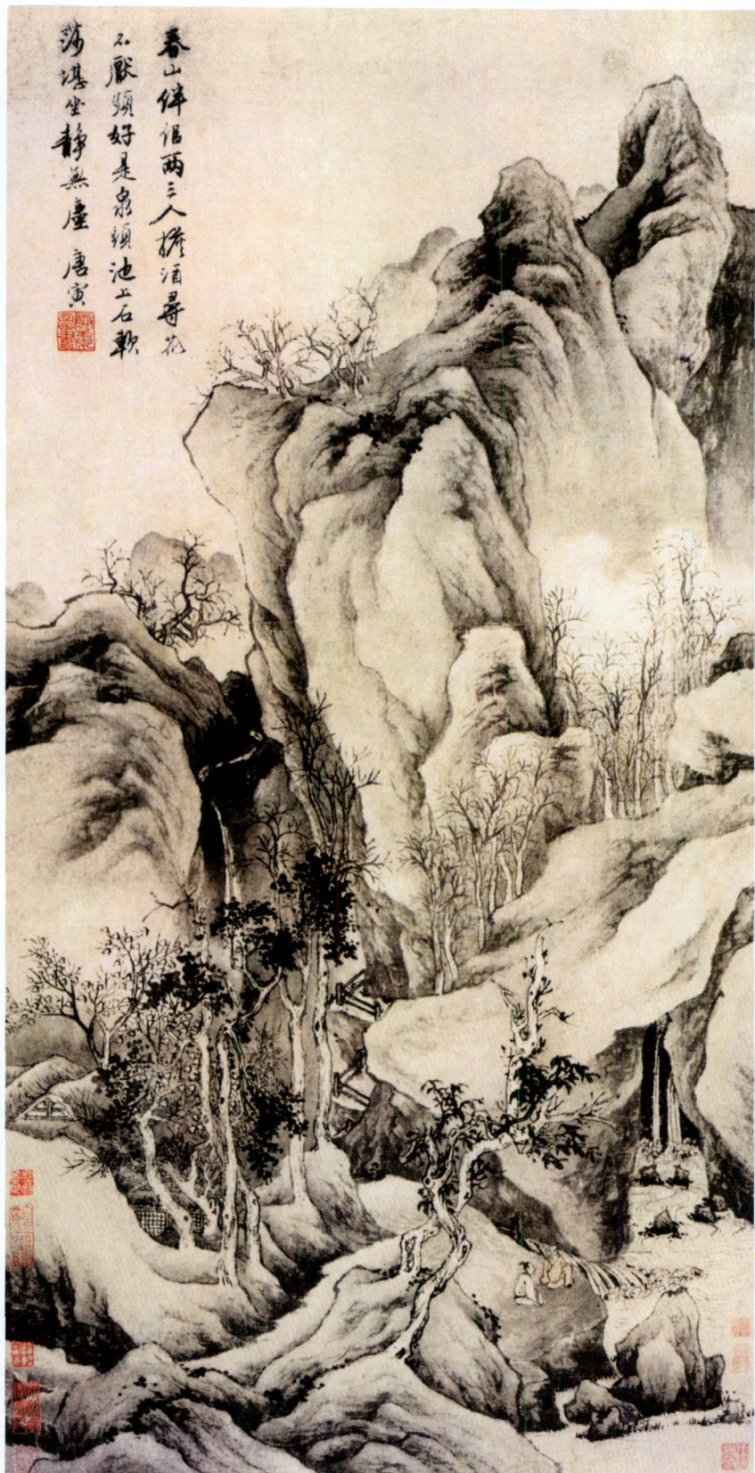
■ 《春山伴侣图》 立轴 纸本 水墨 纵82厘米 横44厘米 上海博物馆藏

至于唐伯虎点秋香的风流韵事，真实的史料也再一次打破了人们的梦想：秋香出生于1450年，比唐伯虎整整大了二十岁，那个年代并不流行姐弟恋，更重要的是他们平生素未晤面，唯一的瓜葛是两人都曾是沈周的学生，只算是做过一回同门师姐弟。