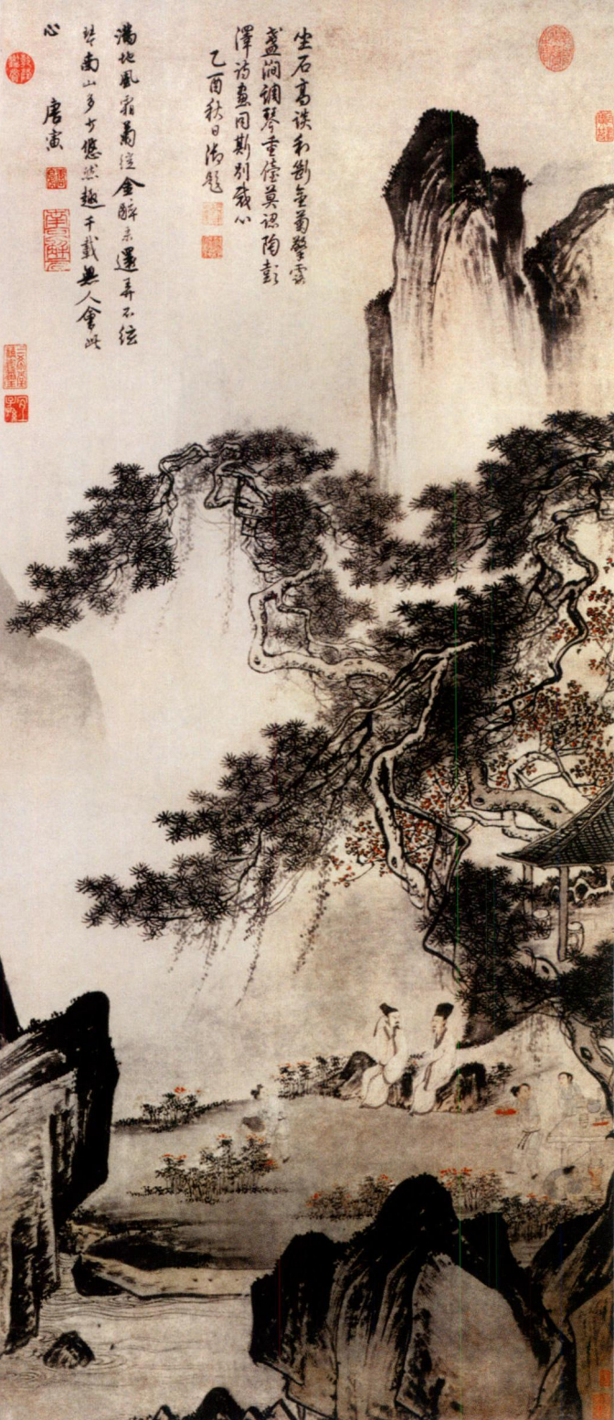
图 《东篱赏菊图》 纸本 设色 纵134厘米 横62.6厘米 上海博物馆藏

此图写赏菊之悠然。图中远山近石峻峭，一劲松高大虬曲，溪水泛波，仆童忙碌，两高士坐于石上赏菊言谈，乐在其中。此图山石勾皴，劲健峭利，坚凝厚实，全幅图挺劲而又秀雅。